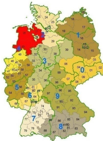
Abbildung 8: Postleitzahlenbereich der Erhebung (vgl. KÜHN 2003)